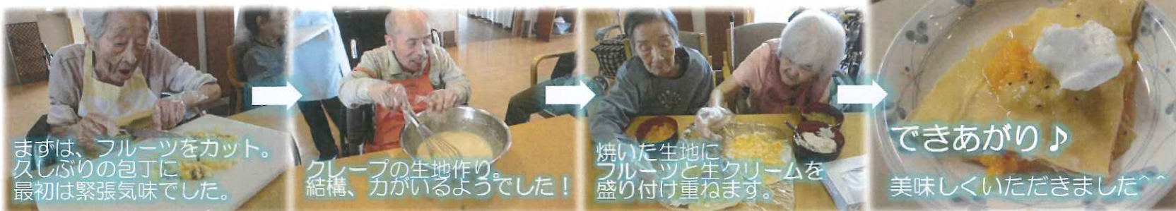
まずは、フルーツをカット。久しぶりの包丁に最初は緊張気味でした。